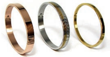
STIL IN STAHL: Modischen Schmuck aus Edelstahl hat Bailin Co. im Angebot.

HARMONISCH: Elegant verbindet die Schmuckmarke tétino des deutschen Herstellers Moser + Pfeil funkelnde Zirkonia und Sterling Silber, zu finden bei der Kurt Herb GmbH .