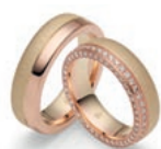
TRAUMPAAR: 86 Brillanten auf dem Damenring und eine angesagte Gelb-Roségoldkombination – die Highclass-Modelle zählen zu den Finest Stars aus der Finest-Linie von Rauschmayer .