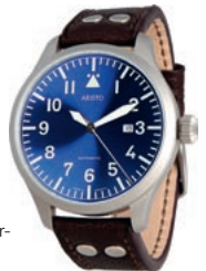
BLAUES WUNDER: Fliegeruhr BLAUE 47 mit Sonnenschliff-Zifferblatt von ARISTO .