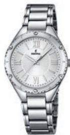
STRAHLEND: Ein klarer, eleganter Look charakterisiert dieses Edelstahl-Damenmodell der Linie Festina Trend .