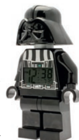
VERSPIELT: Darth-Vader-Wecker aus dem LEGO-Sortiment , erhältlich bei Christoffel .