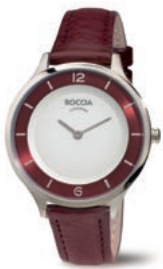
WARMER LOOK: Schwer im Trend liegt die leichte Reintitan-Uhr in rotbraunem Marsala von BOCCIA TITANIUM .