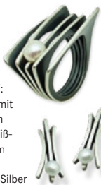
GEFÄCHERT: Eyecatcher mit spannendem Schwarz-Weiß-Farbspiel von LORENA – oxidiertes Silber mit Süßwasser-Zuchtperle, Made in Austria.