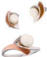
FEINSINNIG: Mit besonderer Finesse verbindet die Kollektion artifex von O&K Müller Sterling Silber mit Süßwasser-Zuchtperlen.