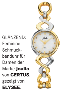
GLÄNZEND: Feminine Schmuckbanduhr für Damen der Marke Joalia von CERTUS , gezeigt von ELYSEE .