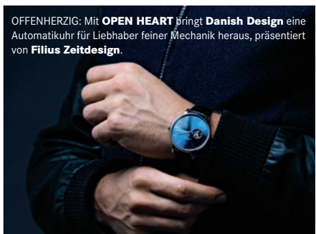
OFFENHERZIG: Mit OPEN HEART bringt Danish Design eine Automatikuhr für Liebhaber feiner Mechanik heraus, präsentiert von Filius Zeitdesign .