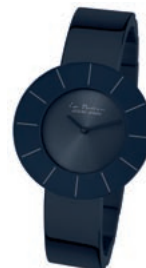
AUFREGEND: Neues aus der Kollektion LA PASSION zeigt JACQUES LEMANS .