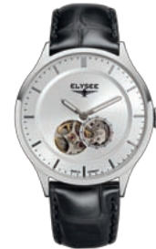
STATEMENT: Die Automatikuhr NESTOR 15100 von ELYSEE erlaubt durch offene Unruhe und Glasboden faszinierende Einblicke – Made in Germany.