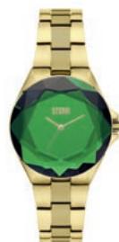
SCHILLERND: Das Prismaglas der Crystana des Kultlabels STORM aus London lenkt neidische Blicke auf das Handgelenk – vorgestellt von TKR Distributions .