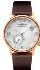
APART: Die Zeppelin Luna 7633-5 im Programm von Christoffel besticht durch ihr Zifferblatt mit Perlmutter-Einlage und Swarovski-Kristallen.