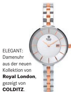
ELEGANT: Damenuhr aus der neuen Kollektion von Royal London , gezeigt von COLDITZ .