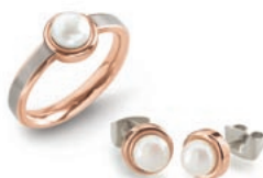
ZAUBERHAFT: Perlen, Gold und Titan vereint der aktuelle Schmuck von BOCCIA TITANIUM auf raffinierte Weise.