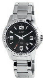
SPORTLICH: Edelstahluhr von JUST by Unique Time .