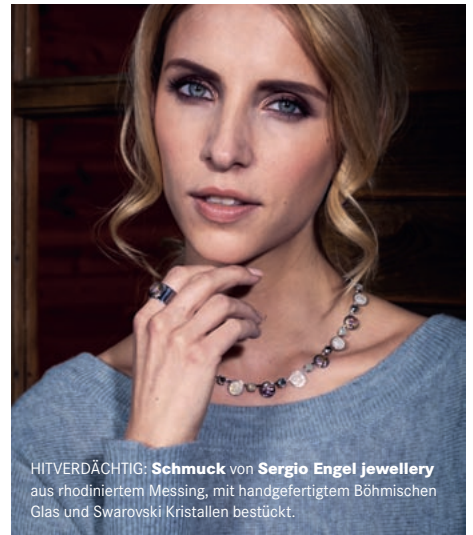
HITVERDÄCHTIG: Schmuck von Sergio Engel jewellery aus rhodiniertem Messing, mit handgefertigtem Böhmischem Glas und Swarovski Kristallen bestückt.