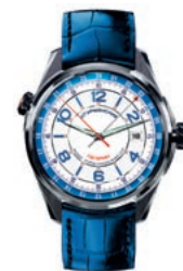
HIMMELSTÜRMER: Gagarin Sport von Sturmanskie aus Russland erinnert an Juri Gagarin, der 1961 als erster Mensch ins Weltall startete. Vertrieb: P. Maier GmbH .