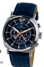
DOMINANT: JACQUES LEMANS hat die Serie LUGANO erweitert, Modell 1-16451 wurde bereits kurz nach Einführung zum Erfolg.