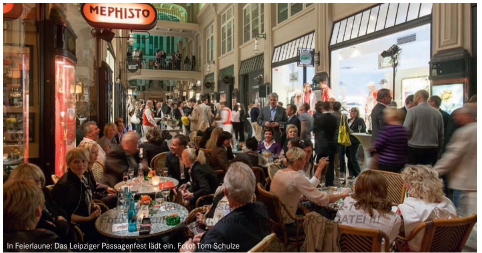
In Feierlaune: Das Leipziger Passagenfest lädt ein.

Klangvoller Gewandhaustag, Variété oder Grusel am 3. September: Ab 15.00 Uhr musizieren Ensembles des Gewandhausorchesters in der Innenstadt – und dies kostenfrei. 20.00 Uhr eröffnet Dirigent Herbert Blomstedt im Gewandhaus mit Beethoven die Saison ( www.gewandhausorchester.de ). Ein artistisches Kontrastprogramm von Breakdance bis Jonglage bietet die Show „Mann-oh-Mann“ im Krystallpalast Variété ( www.krystallpalast.de ).