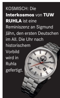
KOSMISCH: Die Interkosmos von TUW RUHLA ist eine Reminiszenz an Sigmund Jähn, den ersten Deutschen im All. Die Uhr nach historischem Vorbild wird in Ruhla gefertigt.