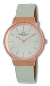
MAKELLOS: IP-Rosé beschichtetes Edelstahlmodell der Marke Claude Pascal von ZIEMER .