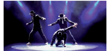
Breakdance mit Fette Moves: Show „Mann-oh-Mann“ des Krystallpalast Variétés Leipzig.

Kabarett am 4. September: 19.00 Uhr serviert die Pfeffermühle mit „da capo“ satirische Klassiker aus dem Repertoire ( www.kabarett-leipziger-pfeffermuehle.de ).