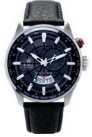
WELTBÜRGER: Das Herrenmodell mit 2. Zeitzone von Royal London gibt es bei COLDITZ in drei Ausführungen.