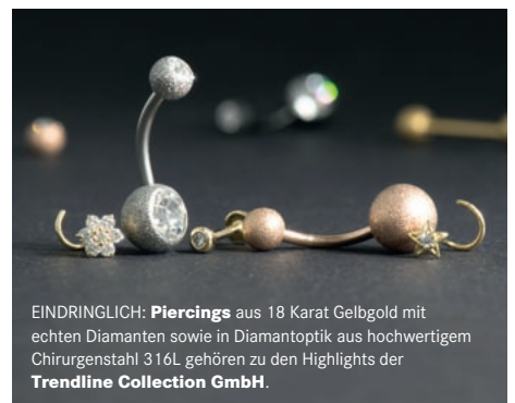
EINDRINGLICH: Piercings aus 18 Karat Gelbgold mit echten Diamanten sowie in Diamantoptik aus hochwertigem Chirurgenstahl 316L gehören zu den Highlights der Trendline Collection GmbH .

Wer im Umfeld seines Geschäfts verdächtige Personen oder Fahrzeuge bemerkt, sollte die Polizei informieren. Profitäter spionieren ihre Opfer vorher oft aus. Außerdem helfen wir kostenfrei beim Erstellen von Sicherheitskonzepten, bieten Schulungen an: Kritische Situationen werden simuliert, damit die Lage im Ernstfall nicht eskaliert.