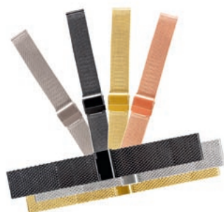
ATTRAKTIV: Edelstahl-Milanaisebänder , 14 bis 24 mm breit, in Stahl sowie drei PVD-Beschichtungen von Christine Bautze , Großhandel für Uhrarmbänder.