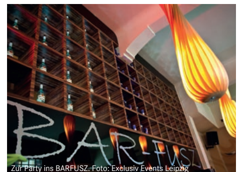
Zur Party ins BARFUSZ.

Heiße Party, coole Location! Die MIDORA-Messeparty steigt am Messesonntag, 4. September, im BARFUSZ – einem Hotspot des Leipziger Nachtlebens mitten in der City. Für Stimmung sorgt die Band „Tänzchentee“ mit Hits der 1960er-, 70er-, 80er- und 90er-Jahre sowie aktuellen Chartkrachern. 19.00 Uhr geht's los (39,00 Euro inkl. Buffet/Getränke, Tickets: 0341/678-8125).