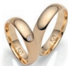
FAIR: Die neue Rauschmayer GreenLine wird aus zertifiziertem Fairtrade-Gold hergestellt – für eine „grüne Hochzeit“ mit gutem Gewissen.