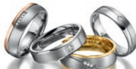
FÜR JA-SAGER: Trauringe aus Gold, Silber, Edelstahl und Titan von MARRYA mit günstigem Preis-Leistungsverhältnis.