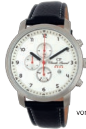
KULTIVIERT: Edelstahl-Chronograf von Claude Pascal by ZIEMER .