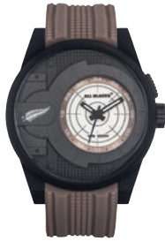
KRAFTVOLL: Markantes Modell der Marke ALL BLACKS von CERTUS – inspiriert vom American Football, zu sehen bei ELYSEE .