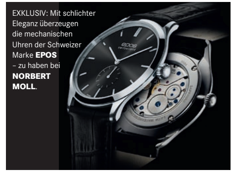
EXKLUSIV: Mit schlichter Eleganz überzeugen die mechanischen Uhren der Schweizer Marke EPOS – zu haben bei NORBERT MOLL .

Vorteilhaft ist, solch ein Produkt am Arm zu tragen und auszutesten. Die Hersteller bieten den Fachhändlern dafür Sonderkonditionen. Ich selbst habe zwei Modelle. Es gibt nichts Besseres, um Know-how zu sammeln. Zudem stellt die Industrie umfangreiches Schulungsmaterial zur Verfügung. Noch haben die Fachhändler Zeit, ihre Beratungskompetenz auszubauen und damit beim Kampf um Marktanteile zu punkten.