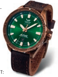
EINDRUCKSVOLL: Limitiertes Automatikmodell im Bronzegehäuse aus der Serie ALMAZ Space Station von Vostok Europe aus Litauen, geführt von der P. Maier GmbH .