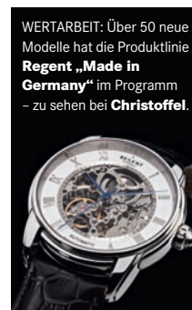
WERTARBEIT: Über 50 neue Modelle hat die Produktlinie Regent „Made in Germany“ im Programm – zu sehen bei Christoffel .