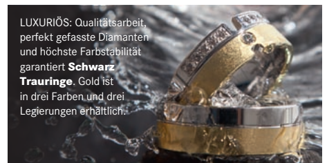
LUXURIÖS: Qualitätsarbeit, perfekt gefasste Diamanten und höchste Farbstabilität garantiert Schwarz Trauringe . Gold ist in drei Farben und drei Legierungen erhältlich.