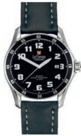
QUALITÄTAVOLL: Hochwertige „Brot und Butter“-Modelle von LE TEMPS OF SWITZERLAND mit Schweizer Ronda-Werken, offeriert von NORBERT MOLL .