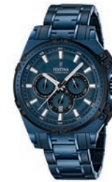
SPORTSGEIST: Die Special Edition Festina Chrono Bike 2016 von Festina ist eine Hommage an den Radsport.