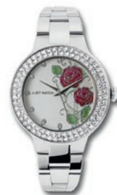
VERTRÄUMT: Feminines Modell der Kollektion Just Watch von Unique Time .