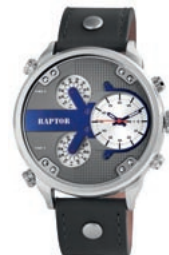
COOL: Die extravaganten Uhren der Lifestyle-Marke RAPTOR sind bei Unique Time zu sehen.