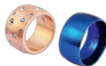
AUSGEFALLEN: Edelstahlringe aus dem Sortiment von SHAGHAFI .